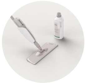
KIT PER LA PULIZIA PGSPRAYKIT