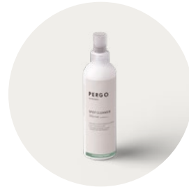
SPOT CLEANER PGSPOTCLEAN