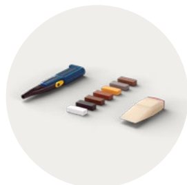
KIT DI RIPARAZIONE PGREPAIR