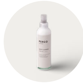
SPOT CLEANER PGSPOTCLEAN