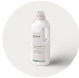
FLOOR CLEANER PGCLEANECO1000